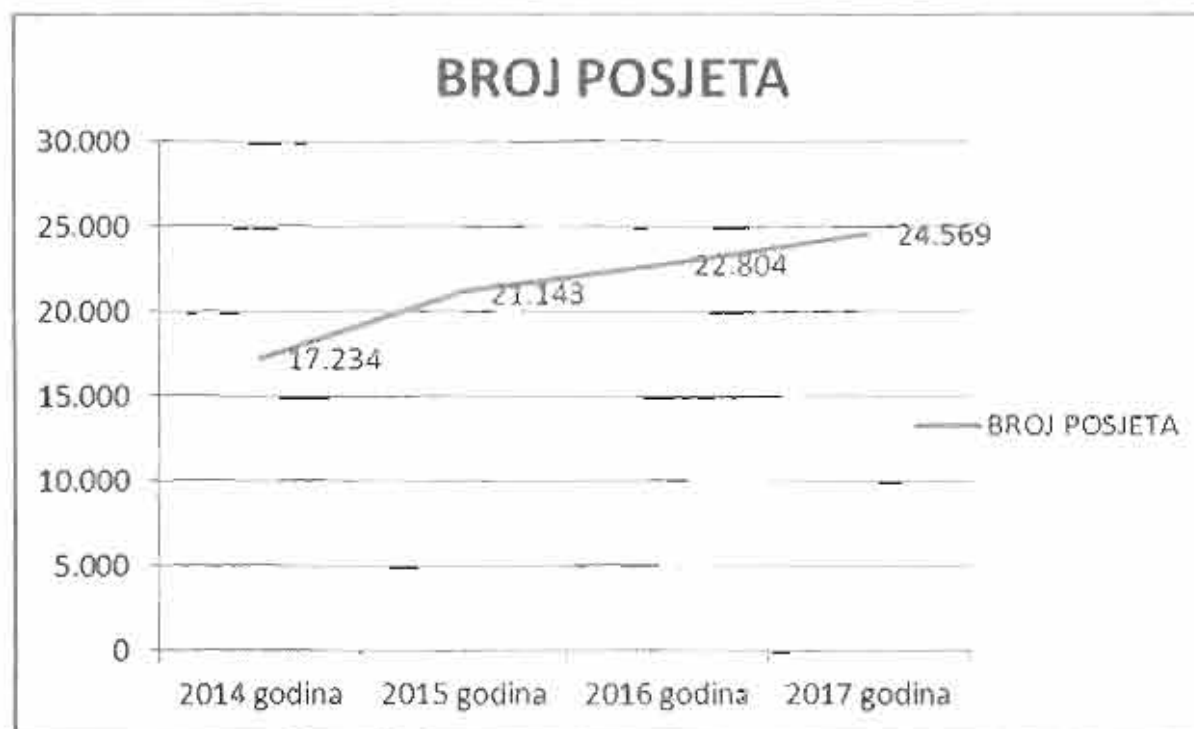
Grafikon 1: ukupan broj posjeta od 2014. do 2017. godine

U nastavku su navedeni podaci o broju po mjesecima, vrsti ulaznica i načinu dolaska.